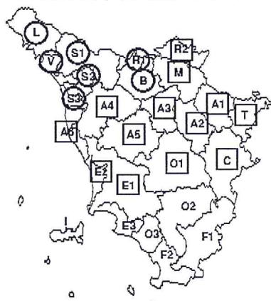
Domenica, 11 Marzo 2018