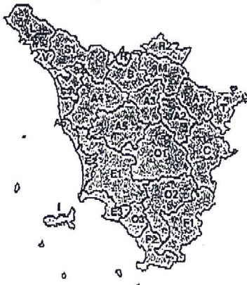
Mercoledì, 14 Marzo 2018